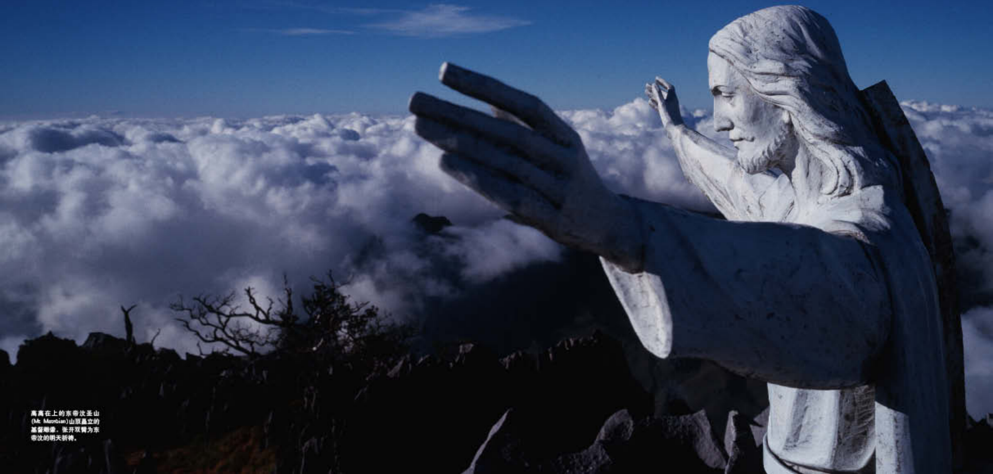
高高在上的东帝汶圣山 (Mt. Maubian)山顶矗立的 基督雕像，张开双臂为东 帝汶的明天祈祷。

或许正是因为这里有待发展，或许正是因为长久以来的宗教信仰，东帝汶人们的生活和大自然的一切有着千丝万缕的神秘联系。从宁静的海滩到令人怦然心动的落日，从纯净的水域到丰富的海洋世界，人们在简单生活中身体力行着朴素的生活哲学：心存感激，充满希望。