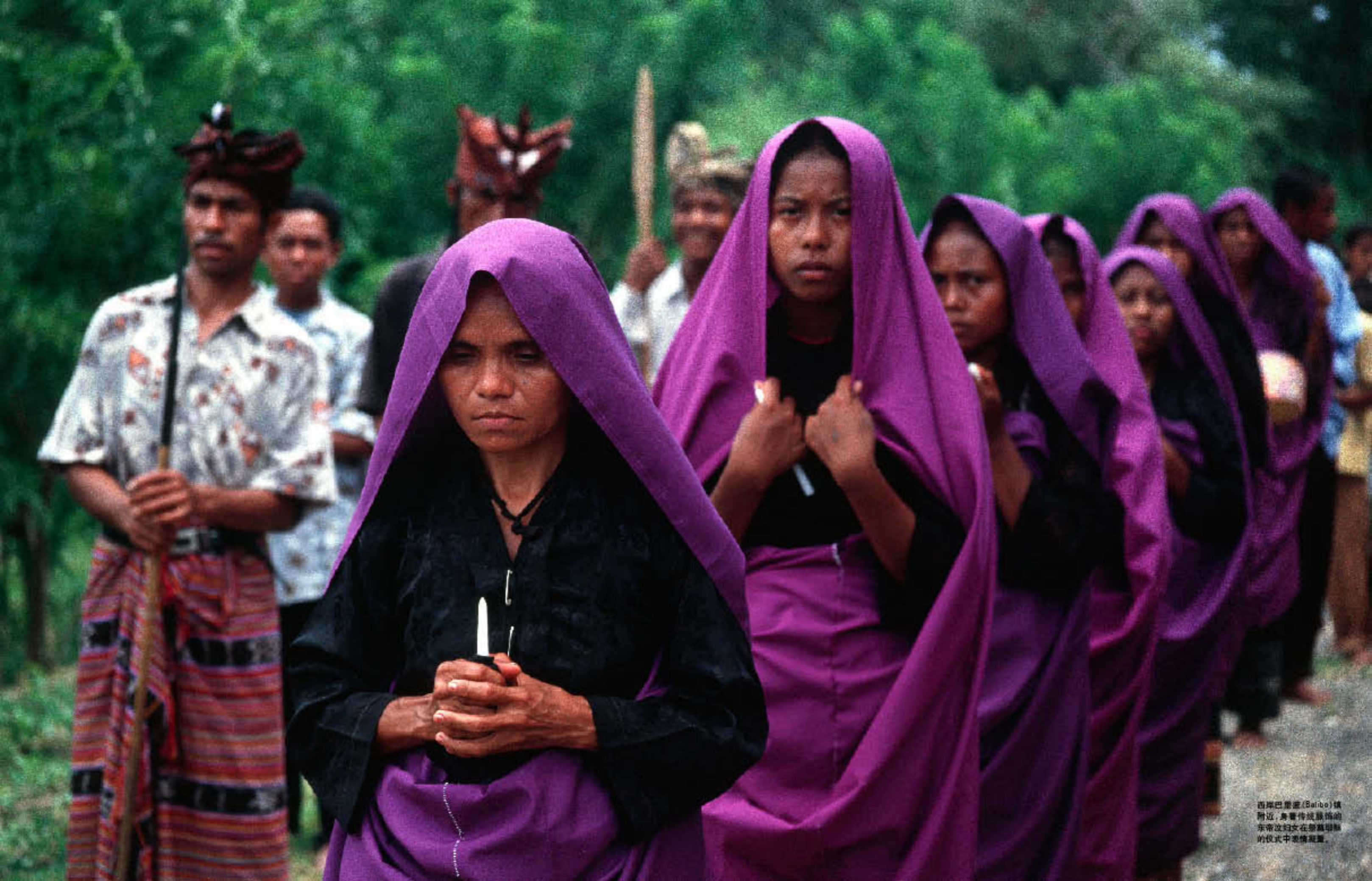
西岸巴里德(Balibo)镇附近,身穿传统服饰的东帝汶妇女在祭奠祖先的仪式中表情凝重。